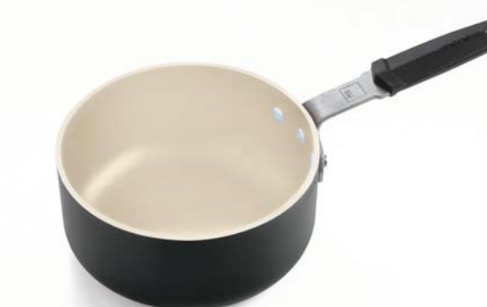
Casseruola 1 manico Saucepan