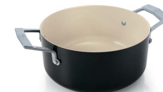
Casseruola 2 maniglie Dutch oven

CM. Ø 24 0006441524 CM. Ø 28 0006441528 CM. Ø 32 0006441532