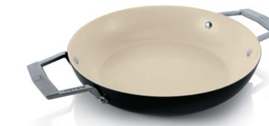
Tegame 2 maniglie 2 handle skillet

CM. Ø 24 0000770124 CM. Ø 28 0000770128 CM. Ø 32 0000770132