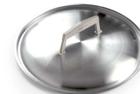
Coperchio in acciaio Steel lid

CM. Ø 24 0006441524 CM. Ø 28 0006441528 CM. Ø 32 0006441532