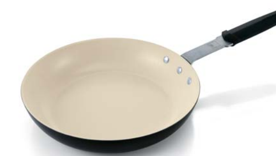
Padella / Frypan

CM. Ø 24 0000770124 CM. Ø 28 0000770128 CM. Ø 32 0000770132